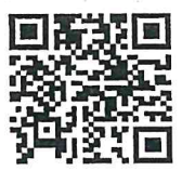
QR-Code ประกาศรับสมัคร

ยื่นใบสมัครตั้งแต่วันที่ 28 ถึง วันที่ 28 กุมภาพันธ์ 2566